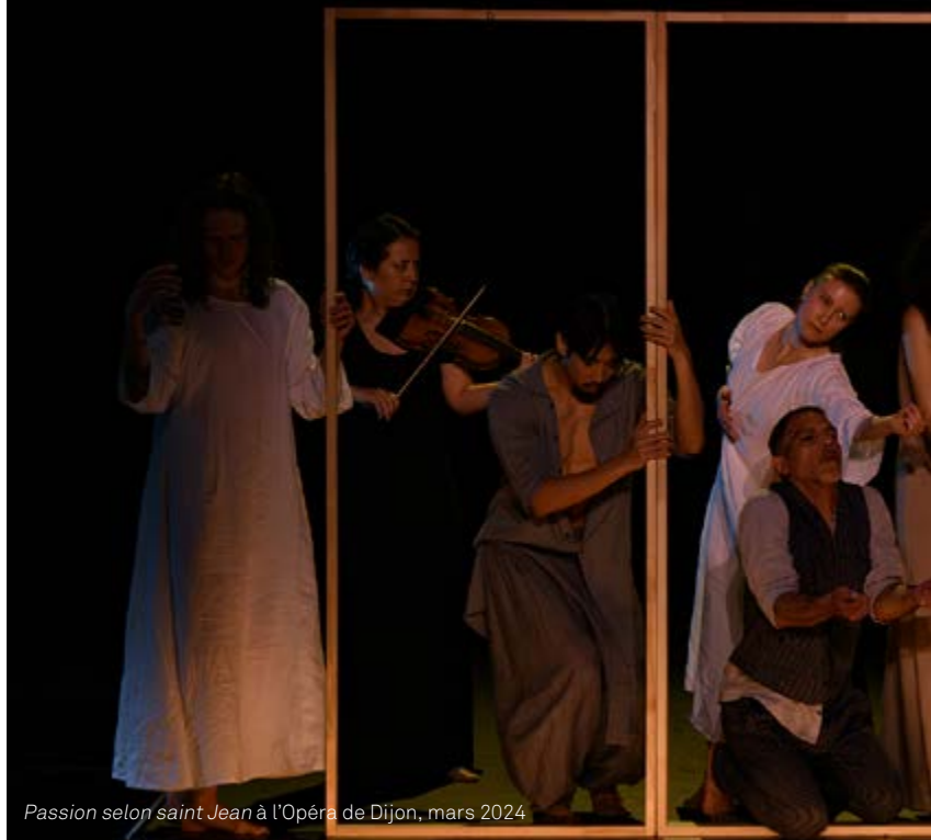
Passion selon saint Jean à l'Opéra de Dijon, mars 2024

Il ritorno d'Ulisse in patria de Monteverdi au Festival d'Aix-en-Provence.